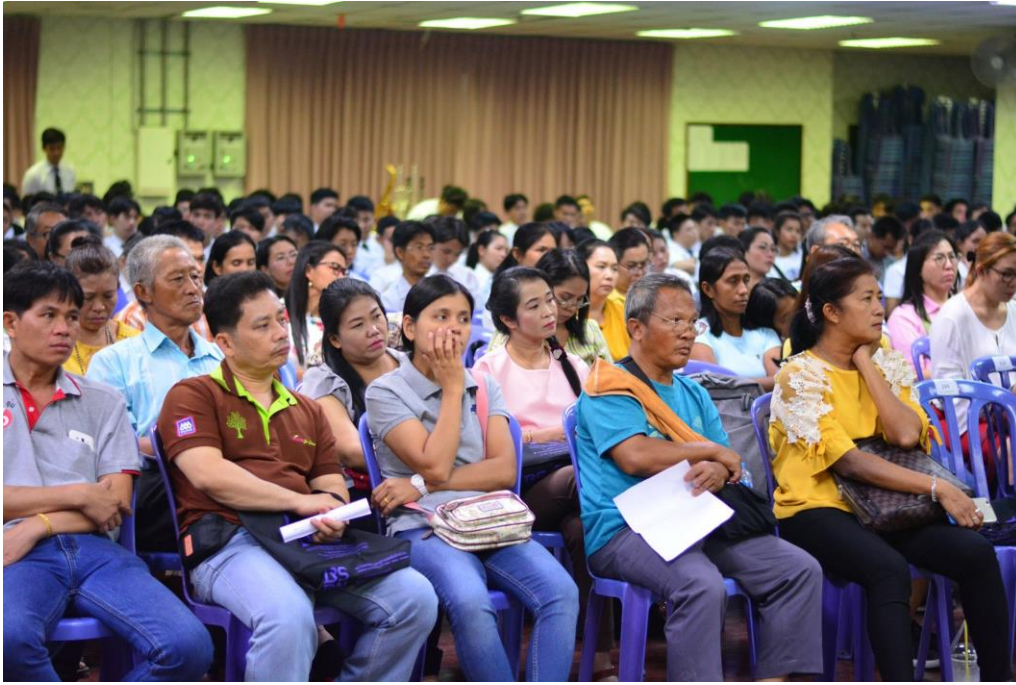
ปฐมนิเทศและประชุมผู้ปกครอง วิทยาลัยการดนตรี มหาวิทยาลัยราชภัฏบ้านสมเด็จเจ้าพระยา ประจำปีการศึกษา 2562