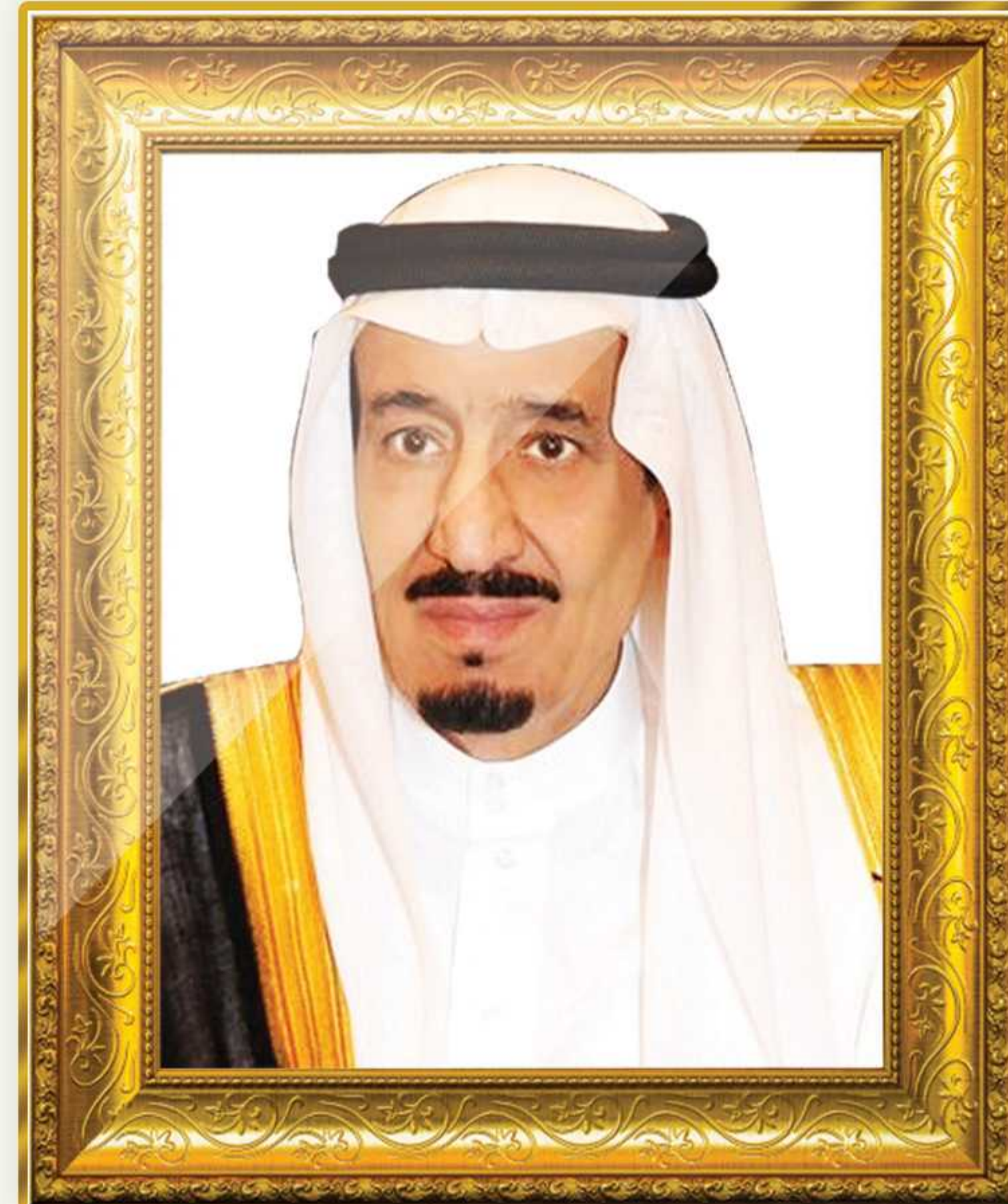
خادم الحرمين الشريفين الملك سلمان بن عبدالعزيز آل سعود