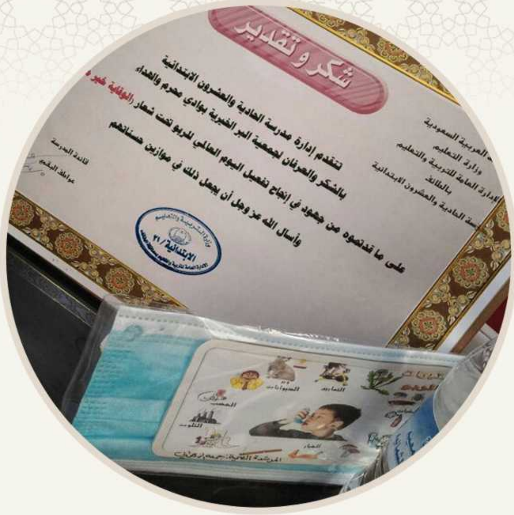
تفعيل اليوم العالمي للربو وسرطان الثدي وصحة الأسنان