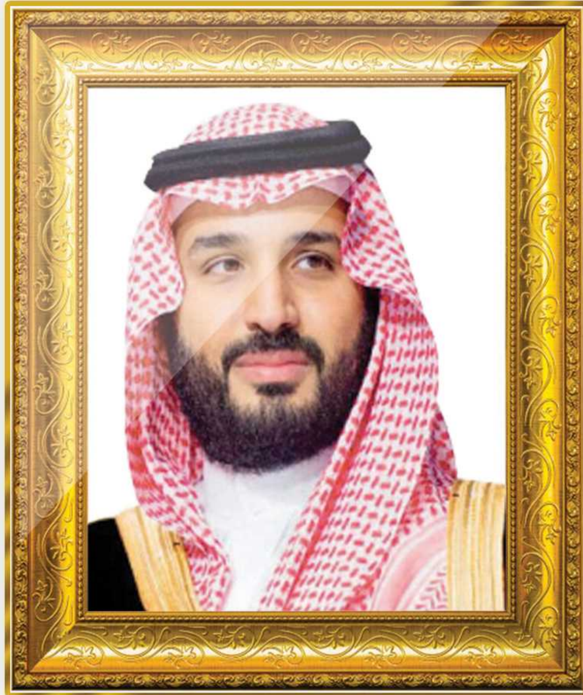
ولي العهد ونائب رئيس مجلس الوزراء الأمير محمد بن سلمان آل سعود