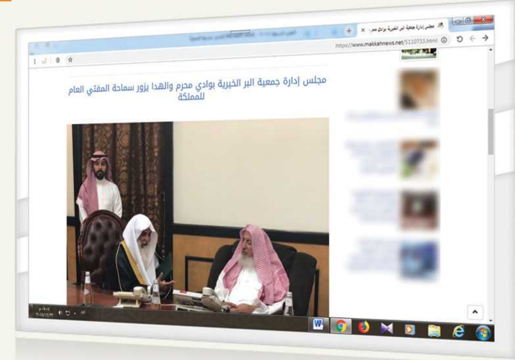
مجلس إدارة جمعية البر الخيرية بوادي محرم والهدا يزور سماحة المفتي العام للمملكة