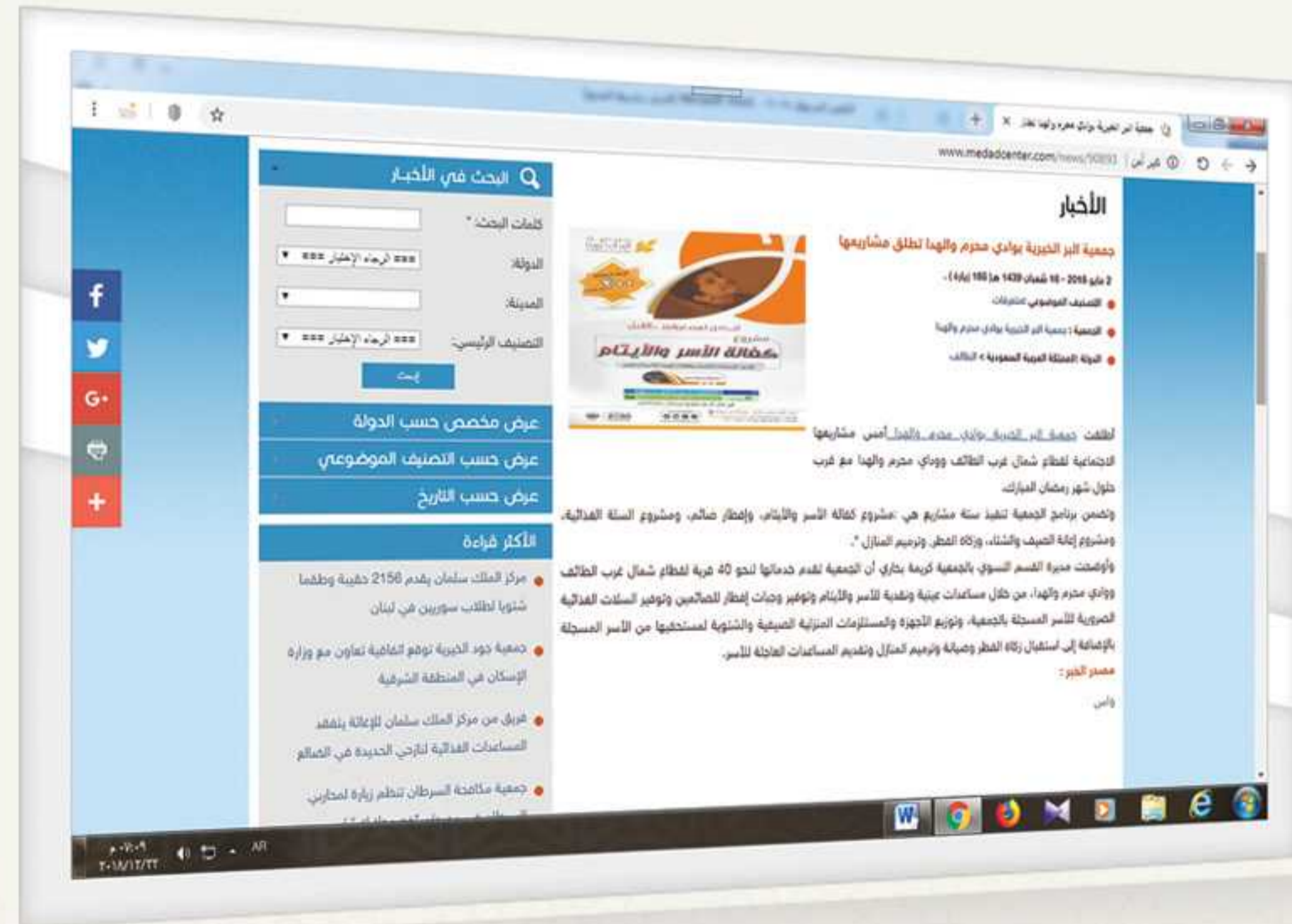
جمعية البر الخيرية بوادي محرم والهدا تطلق مشاريعها