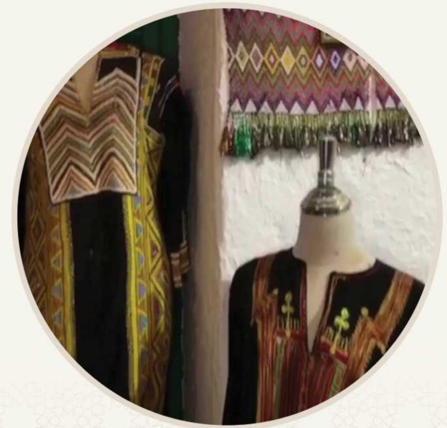
تفعيل حفل الجنادرية بدار الرعاية الاجتماعية للكبيرات