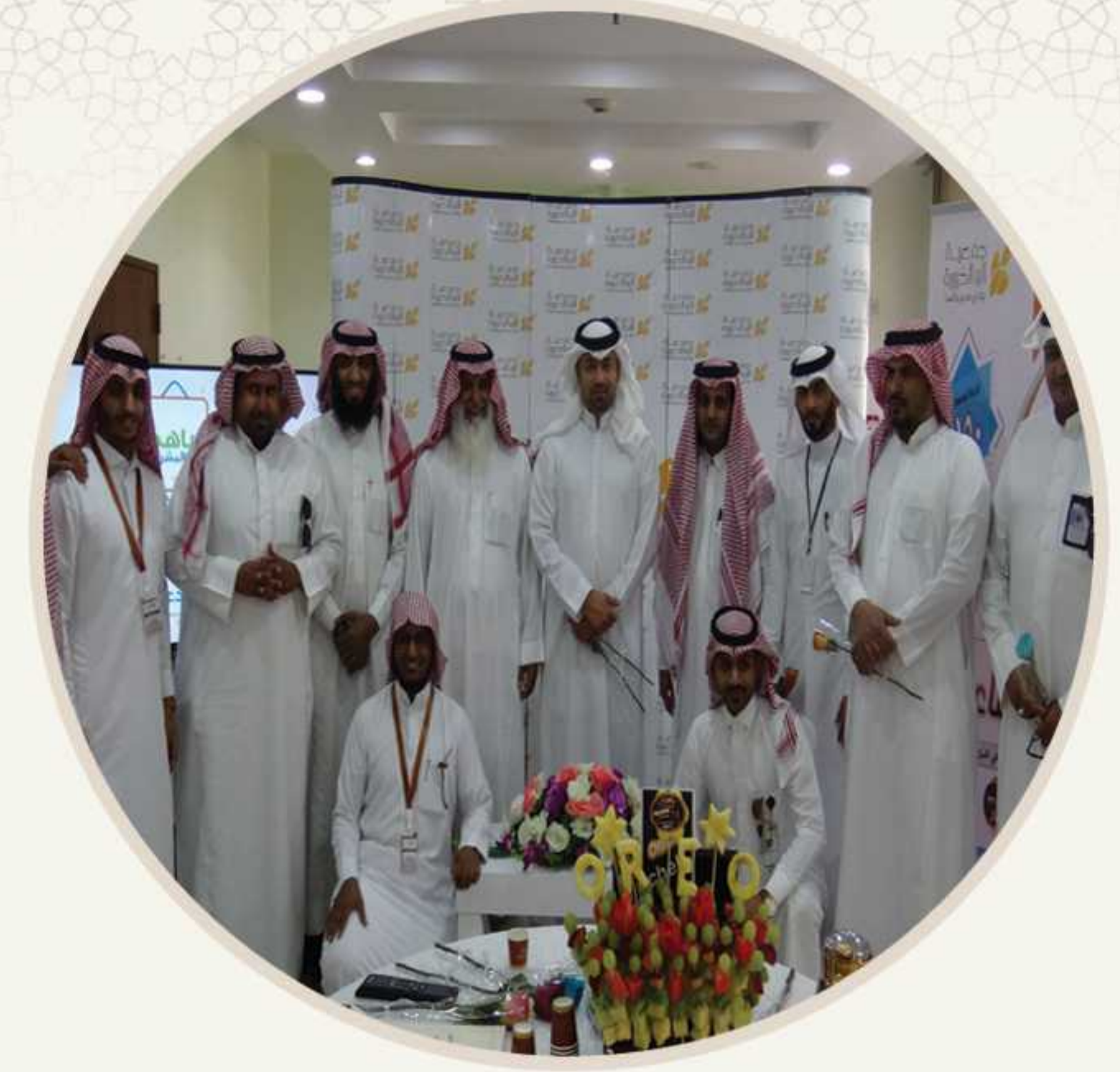
المكتب تعريفى بمستشفى الملك عبدالعزيز التخصصي لمدة اسبوع ( داوود ا مرضاكم بالصدقة )