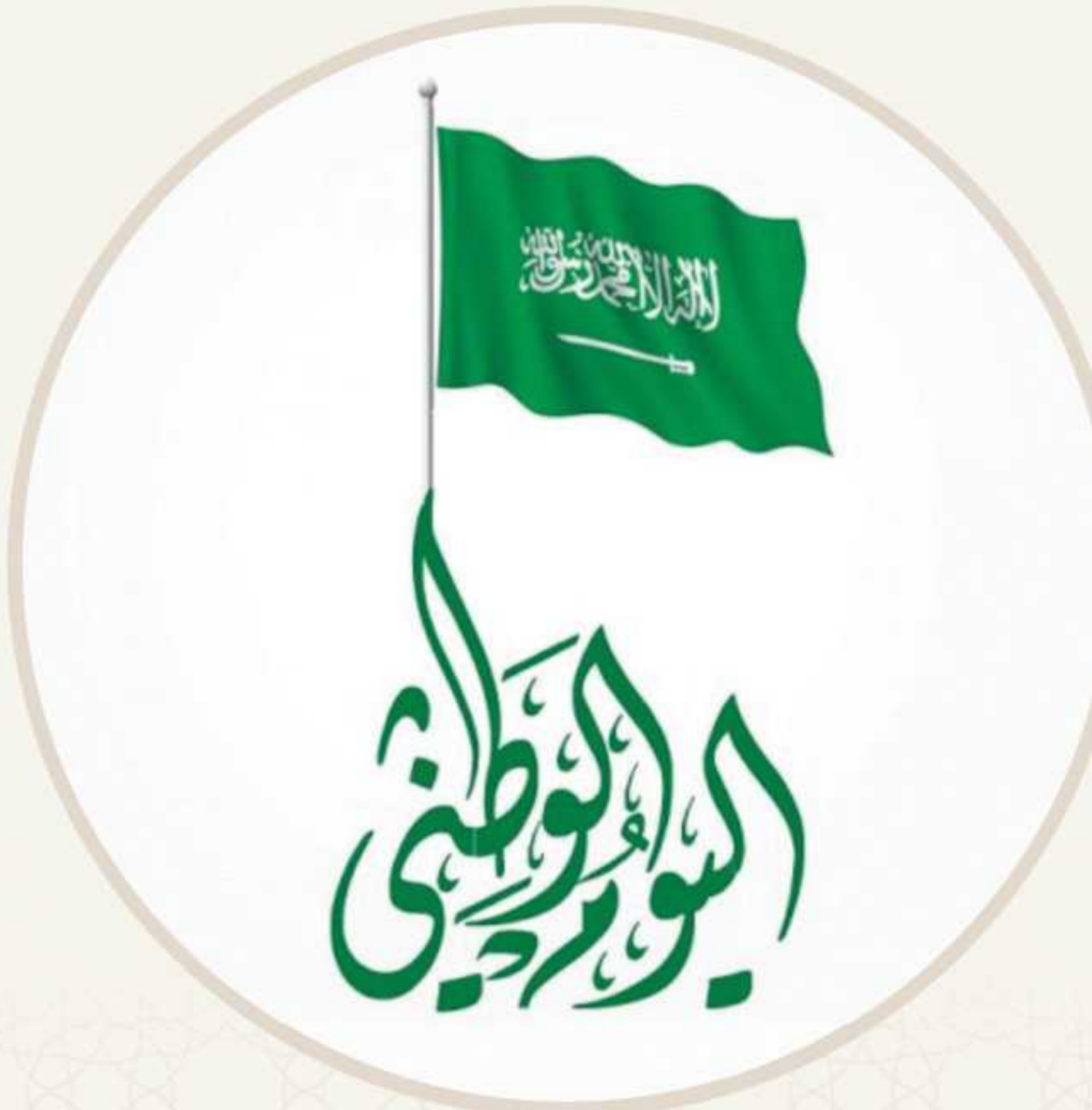
تفعيل اليوم الوطني بمستشفى الملك عبدالعزيز التخصصي بقسم الكلى