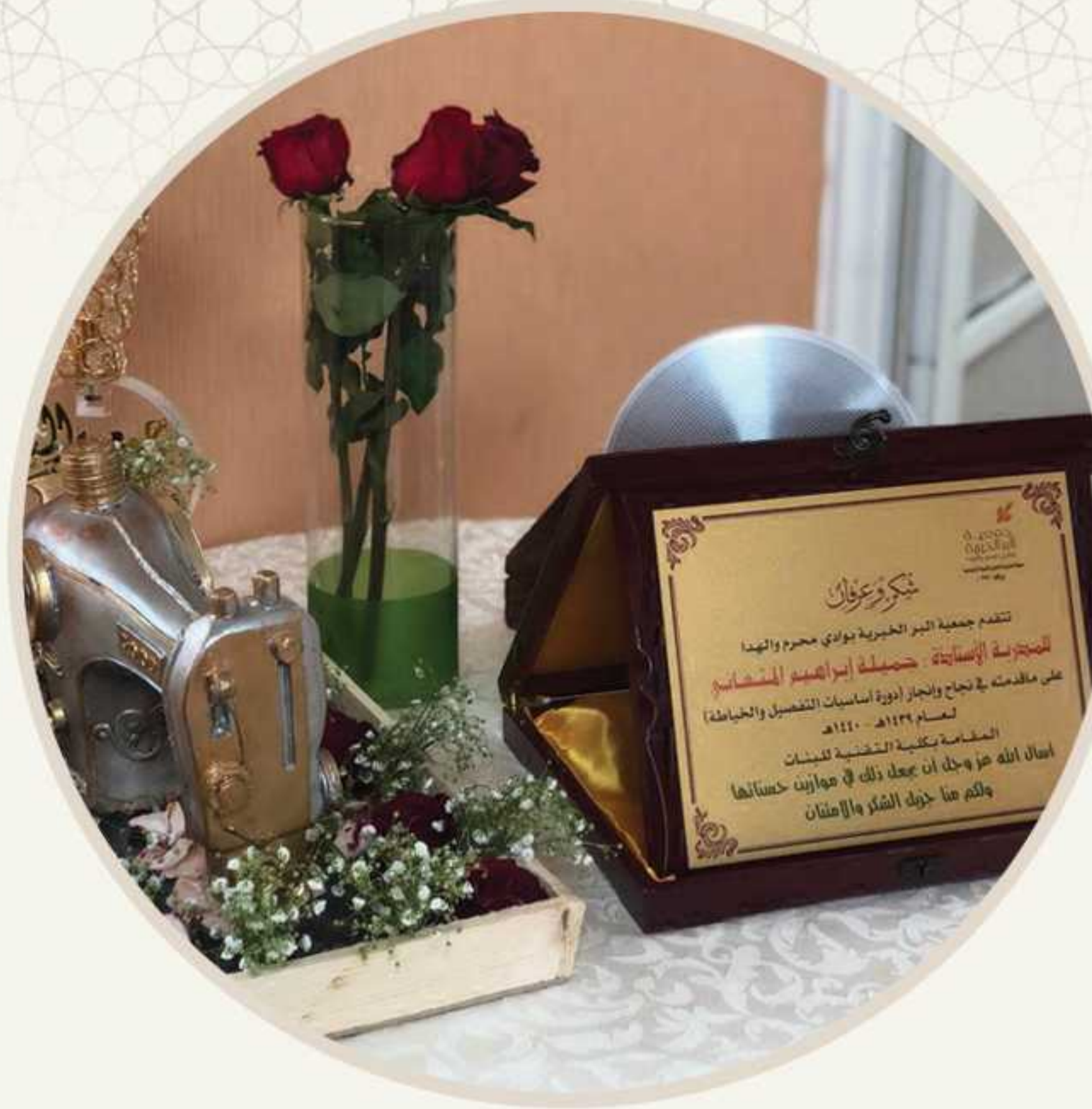
المشاركة في فرحة نجاح برنامج تكريم الناجحات من بنات المستفيدات