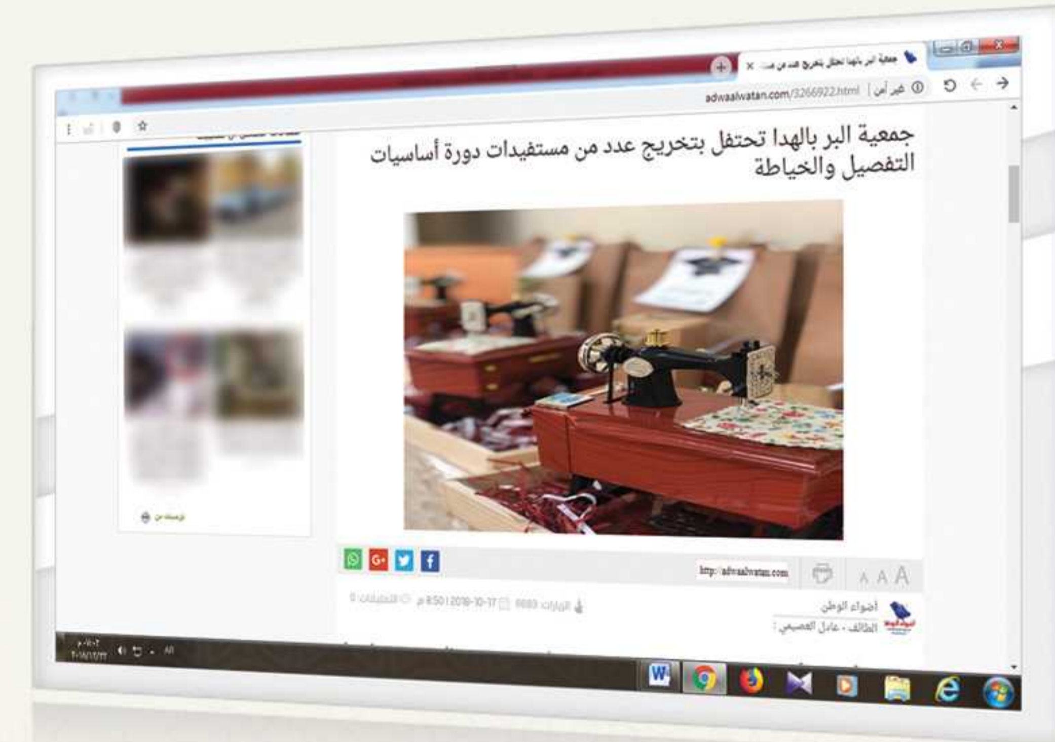
جمعية البر بالهدا تحتفل بتخريج عدد من مستفيدات دورة أساسيات التفصيل والخياطة