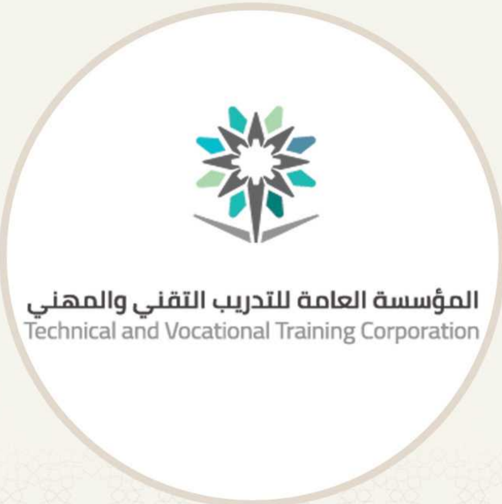
المشاركة في ملتقى التوظيف الثاني لوحدة المؤسسة العامة للتدريب التقني والمهني بمحافظة الطائف