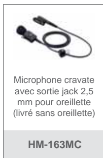
Microphone cravate avec sortie jack 2,5 mm pour oreillette (livré sans oreillette)