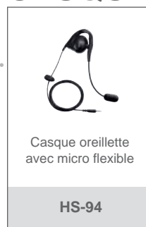
Casque oreillette avec micro flexible