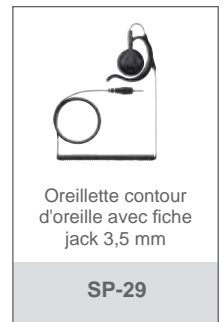
Oreillette contour d'oreille avec fiche jack 3,5 mm