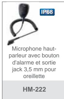
Microphone haut-parleur avec bouton d'alarme et sortie jack 3,5 mm pour oreillette