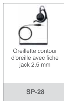
Oreillette contour d'oreille avec fiche jack 2,5 mm