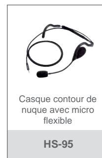
Casque contour de nuque avec micro flexible