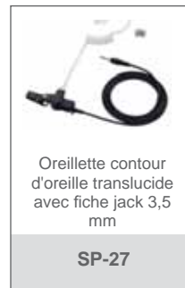
Oreillette contour d'oreille translucide avec fiche jack 3,5 mm