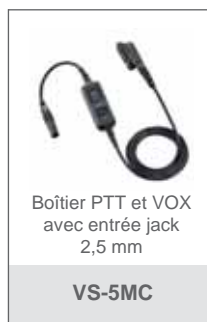
Boîtier PTT et VOX avec entrée jack 2,5 mm