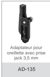
Adaptateur pour oreillette avec prise jack 3,5 mm