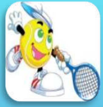
Vladimír Pulkrabek – Vladimír Garab