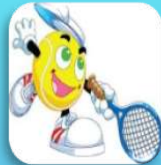
Jiří Flégr – Vladimír Pulkrabek – čtvrtfinalisté pohárové části turnaje