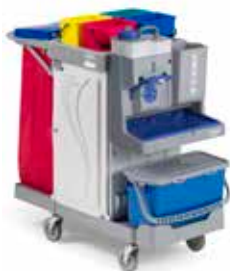
Art. MA0306702U000 cm 121x58x114 h