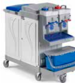
Art. MA3806710U000 cm 136x58x110 h