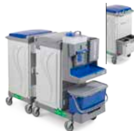
Art. MR3806814U000 cm 146x58x117 h