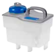
Art. P210017TA Réservoir translucide 6 L avec bouchon de couleur, complet avec clé Transparenter Tank 6 L mit farbigem Scharubverschluss und Schlüssel