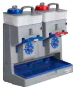
Art. P310200UA Equodose avec 2 réservoirs de 6 L avec bouchon bleu et bouchon rouge Equodose mit 2 Tanken 6 L mit blauem und rotem Schraubverschluss