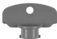
Art. P110014U Clé standard Standard Schlüssel