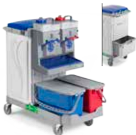
Art. MA0706806U000 cm 118x58x120 h