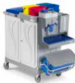
Art. MA0806709U000 cm 138x58x120 h