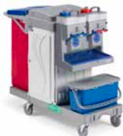
Art. MA3606705U000 cm 140x58x110 h