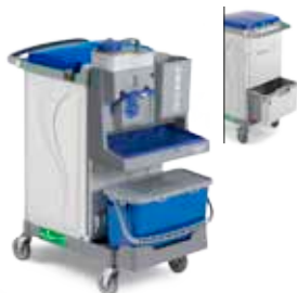
Art. MR3806814U000 cm 94x58x120 h