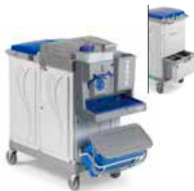
Art. MA3806809U000 cm 138x58x120 h