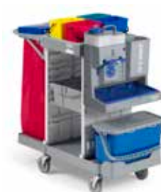
Art. MA0306702U000 cm 121x58x114 h