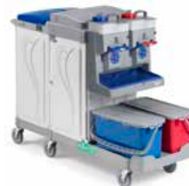
Art. MA3806711U000 cm 153x58x110 h