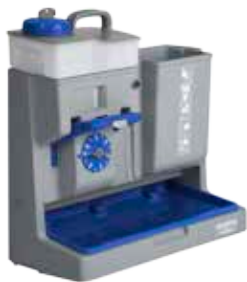
Art. P310100UA Equodose avec 1 réservoir de 6 L avec bouchon bleu Equodose mit 1 Tank 6 L mit blauem Schraubverschluss