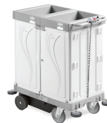
ALPHA HOTEL DRIVE 07HA0648005U - 97x58x114 cm