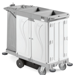
ALPHA HOTEL DRIVE 07HA0648003U - 142x58x114 cm