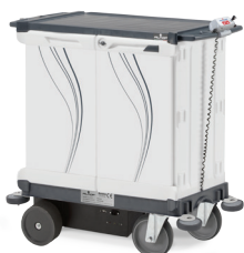
EMOTION DRIVE 07SE0400020PE - 110x64x110,5 cm