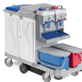
ALPHA DRIVE 07MA3848711U - 153x58x120 cm