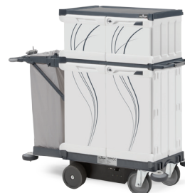
EMOTION DRIVE 07SE0305020PE - 154x64x149,5 cm