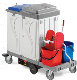
ALPHA DRIVE 07MA3848400U - 139x68x120 cm