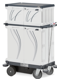
EMOTION DRIVE 07SE0304020PE - 110x64x149,5 cm