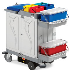
ALPHA DRIVE 07MA0848703U - 120x58x124 cm