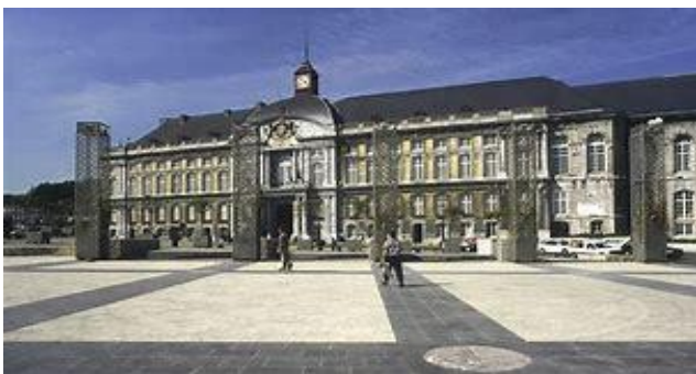
Palais des Princes-Evêques