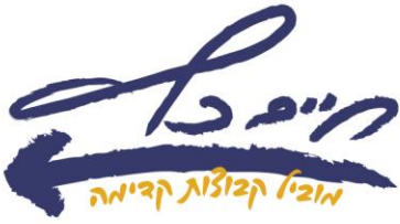
הגיעו לסך 65