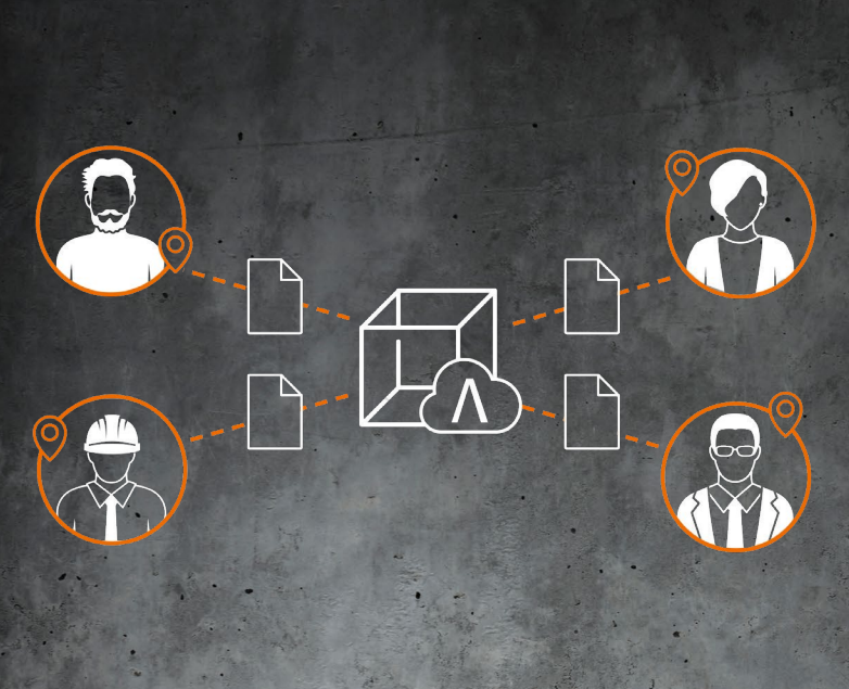
Verbesserte Teamarbeit mit Allplan Share