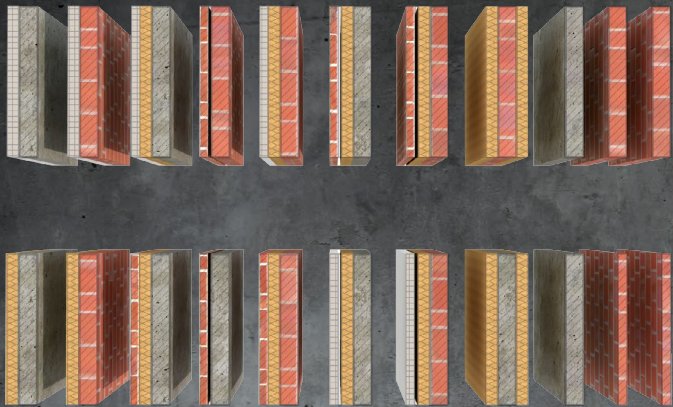
Optimierungen bei Wänden, Dächern und Stahlbau