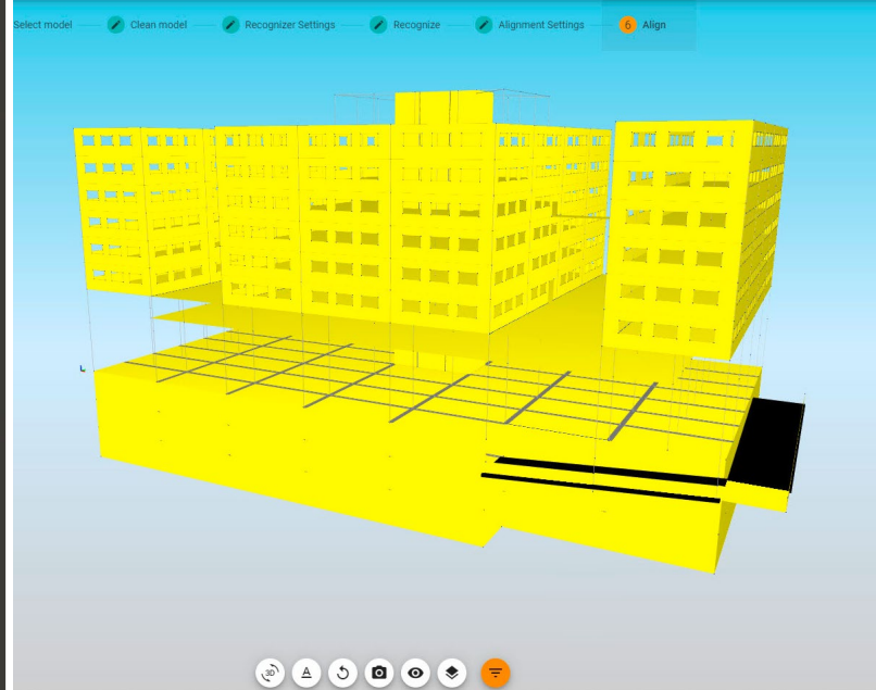
Bürostandard für BIM-gerechte Arbeitsweise