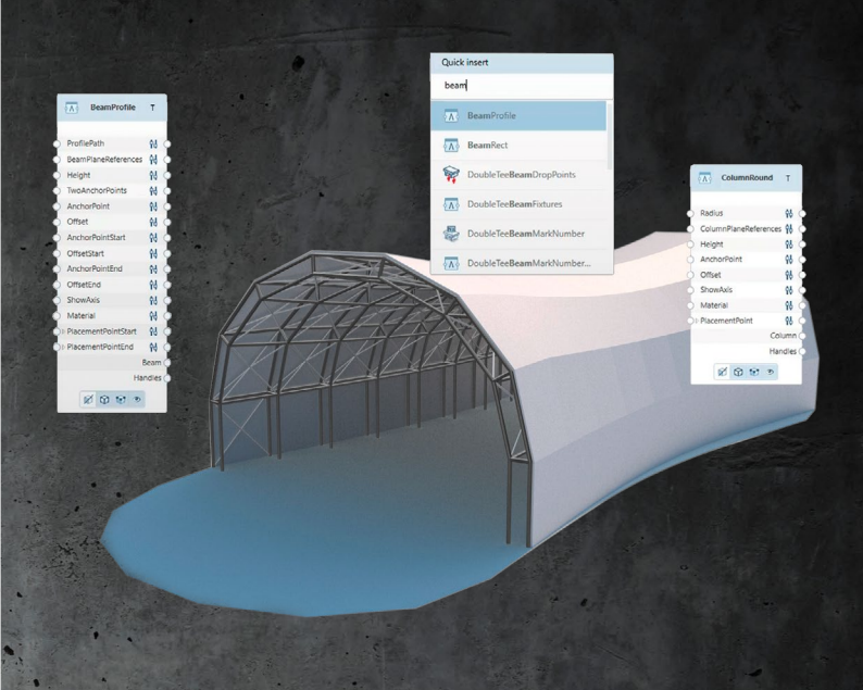
Visual Scripting: Optimierungen bei den Nodes

Durch optimierte Datenaufbereitung, Vermeidung von unnötigen Aktualisierungen und Zwischenspeicherung von Daten wurde auch der Zeitbedarf bei der Aktualisierung von Legenden spürbar reduziert. Über Teilbildfilter können Sie genau festlegen, welche Daten über Reports ausgewertet werden sollen, was ebenfalls zu einer deutlichen Beschleunigung beiträgt.